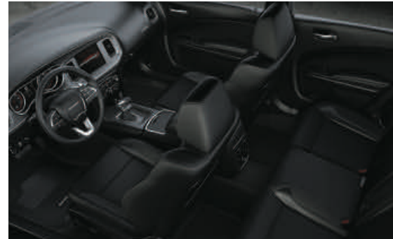
Nappaleder-Sportsitze – Schwarz