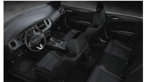
Sportledersitze mit Metallakzenten/Schwarz*