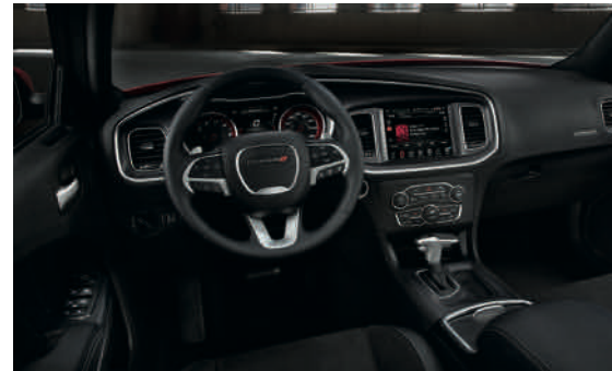
Nappaleder-Sportsitze – Schwarz