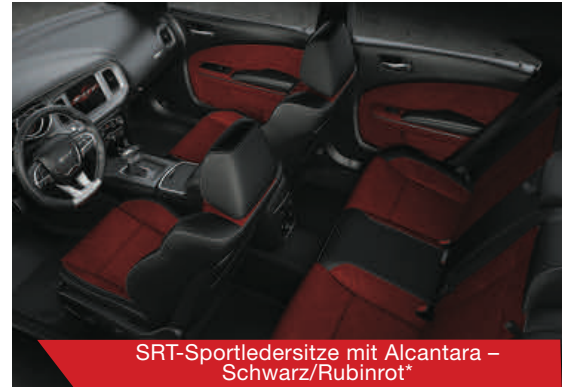
SRT-Sportledersitze mit Alcantara – Schwarz/Rubinrot*