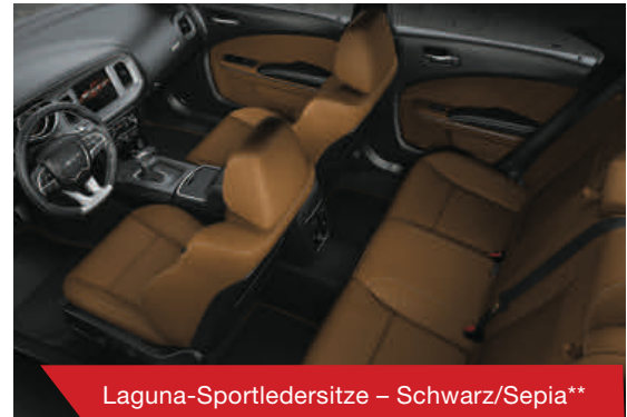
Laguna-Sportledersitze – Schwarz/Sepia**

*auch in Schwarz erhältlich ** auf Kundenanfrage erhältlich, auch in Schwarz